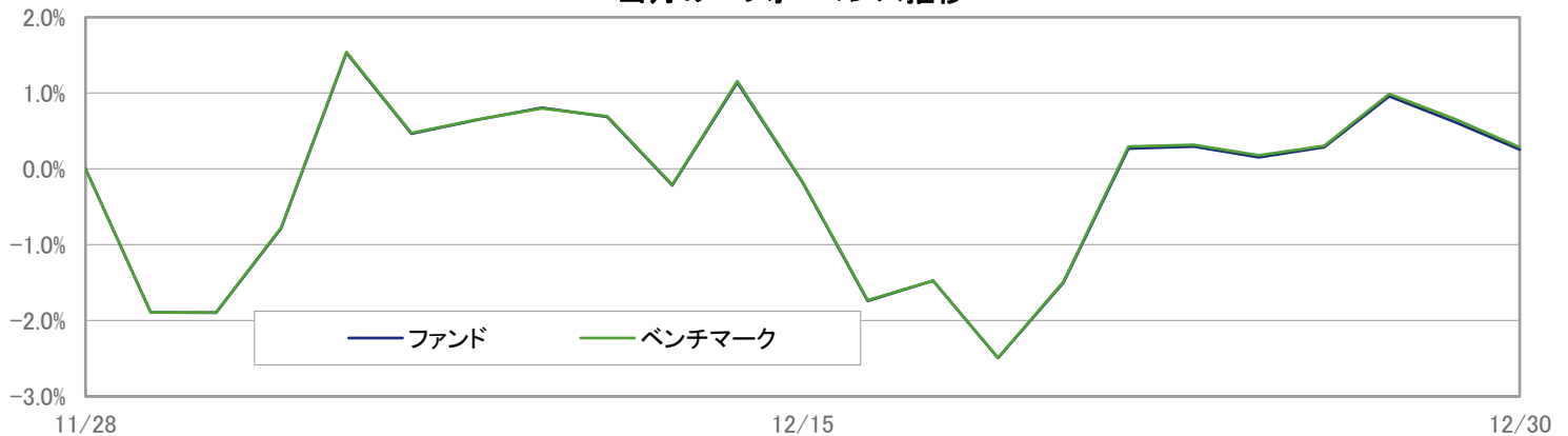
当月のパフォーマンス推移

※ 上記のグラフは過去のものであり、将来の運用成果を保証するものではありません。