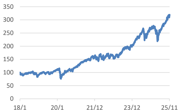
MSCI-WORLDインデックス (税引後配当込み、円ヘッジなし・円ベース)