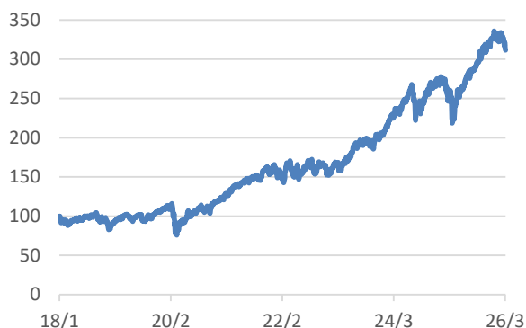
MSCI-WORLDインデックス (税引後配当込み、円ヘッジなし・円ベース)