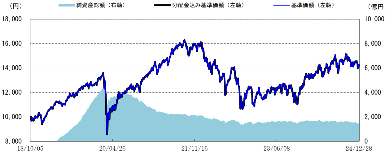
<基準価額の推移グラフ>

※分配金込み基準価額は、当ファンドに分配金実績があった場合に、当該分配金（税引前）を再投資したものと計算した理論上のものである点にご留意ください。 ※基準価額は、信託報酬（後述の「手数料等の概要」参照）控除後の値です。