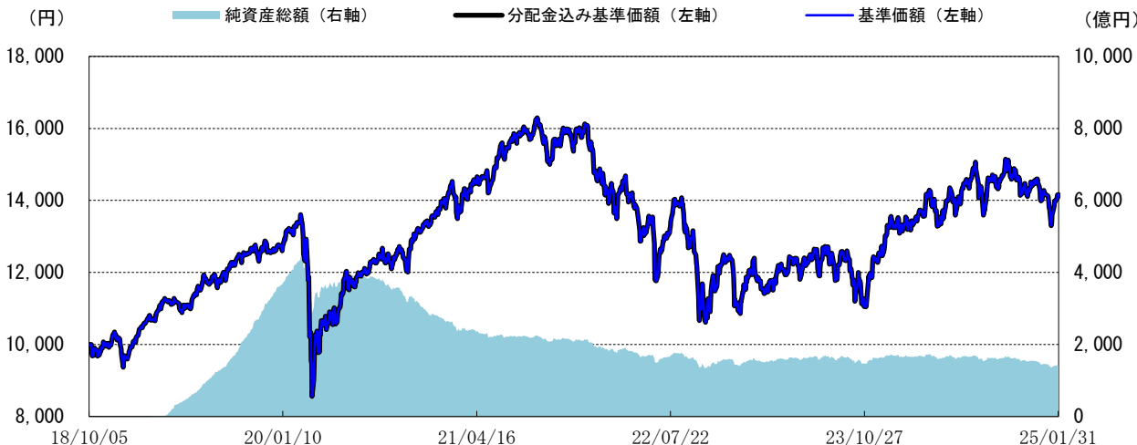
＜基準価額の推移グラフ＞

※分配金込み基準価額は、当ファンドに分配金実績があった場合に、当該分配金（税引前）を再投資したものと計算した理論上のものである点にご留意ください。 ※基準価額は、信託報酬（後述の「手数料等の概要」参照）控除後の値です。