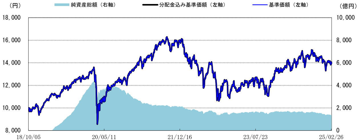
＜基準価額の推移グラフ＞

※分配金込み基準価額は、当ファンドに分配金実績があった場合に、当該分配金（税引前）を再投資したものと計算した理論上のものである点にご留意ください。 ※基準価額は、信託報酬（後述の「手数料等の概要」参照）控除後の値です。