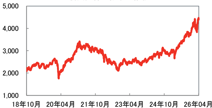
新興国株式指数の推移