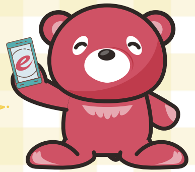
当社オリジナルキャラクター eクマ