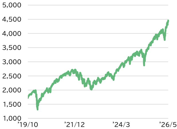
■ MSCI ACWI ex JAPAN(配当込み)(米ドルベース)の推移