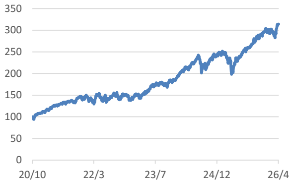
MSCI-WORLDインデックス (税引後配当込み、円ヘッジなし・円ベース)