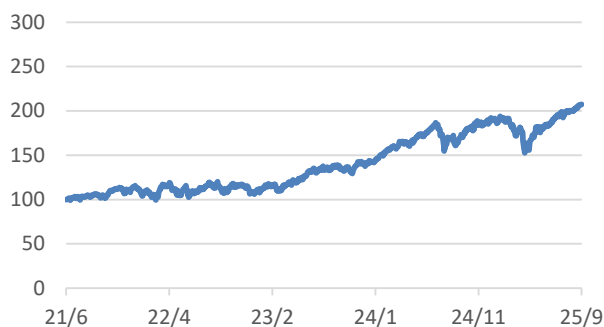
MSCI-WORLDインデックス (税引後配当込み、円ヘッジなし・円ベース)