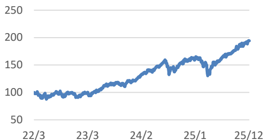
MSCI-WORLDインデックス (税引後配当込み、円ヘッジなし・円ベース)