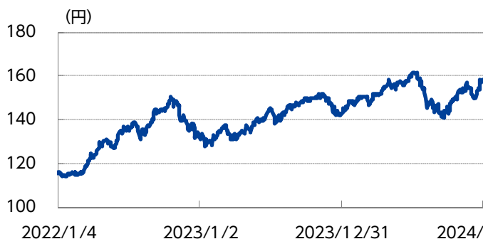
為替（米ドル・円レート）の推移（直近3年間）