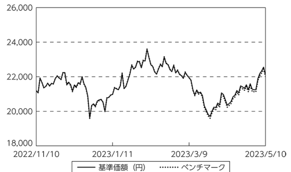
基準価額等の推移

(注) ベンチマークは期首の値をファンド基準価額と同一になるよう指数化しています。