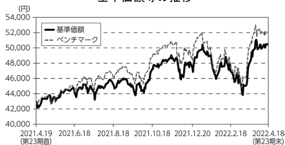
基準価額等の推移

(注) ベンチマークは期首の値を当マザーファンドの基準価額と同一となるように指数化しています。