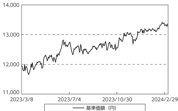
基準価額等の推移