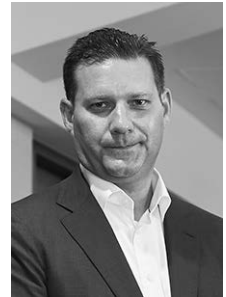
ヴォヤ・インベストメント・マネジメント・カンパニー・エルエルシー リード・ポートフォリオ・マネージャー

サイバーセキュリティ産業は、一時的ではなく、今後も成長が継続すると考えています。絶えず変化する環境やテクノロジーの影響を受け、長期的に成長が見込まれる産業です。サイバー犯罪の高度化やクラウド技術の活用などにより、新しいセキュリティ対策が必要となるため、従来のセキュリティ企業は、新しいテクノロジーの開発や、中小企業の買収などを進めています。新興のセキュリティ企業は、クラウドデータを保護するソリューションの設計などを行い、急速に成長しています。魅力的な製品やサービスを提供し、効率的なビジネス・モデルを有するサイバーセキュリティ企業は、将来的に、売上高や収益性の大幅な拡大を期待できるとみています。サイバーセキュリティへの支出は今後も継続して必要となり、このようなポジティブな要因によって、今後数年にわたり、サイバーセキュリティ産業のリーダー的地位にいる企業は、魅力的な売上高成長を達成することができるとみています。テクノロジー関連株式は短期的に値動きが大きくなることもあるものの、最終的には業績の伸びが長期的な株価上昇の牽引役と考えています。そこに十分な投資機会があると考えており、我々のリサーチ重視のボトムアップ・プロセスはこの投資テーマで作り出される価値を捉える最も効果的な手段であると考えています。