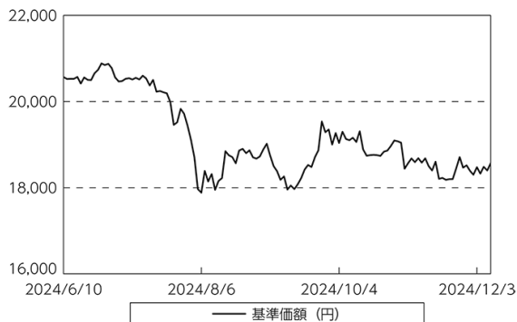
基準価額等の推移