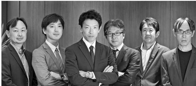
株式運用部 ファンドマネージャー

ビューティー市場を支えるビューティー関連消費は非常に安定的なものです。美しくなりたいという「美の追求」は、世界中の老若男女共通であり、その根源的な欲求が需要を支えているわけですが、様々な成長ドライバーも存在します。新興国における中間層の台頭によって、より多くの方がビューティーを楽しむことができるようになることは、ビューティー市場の裾野を広げます。また、男性向け化粧品市場の拡大や、これまで使用率が低かったフレグランス需要の拡大などは、ビューティー市場における潜在的な需要を掘り起こします。さらに、より高い効果効能が求められるアンチエイジング向けやダーマコスメ商品（特定の肌の悩みに合わせた化粧品）の開発や、パーソナライズされたビューティーケアなどは、プレミアム化を通じてビューティー市場の拡大に寄与します。足元で中国の化粧品需要の回復が遅れているようですが、グローバルでは引き続きプラスの成長が維持される見込みです。ビューティー市場は今後の成長ドライバーも多く存在するため、中長期的に安定した成長が見込める市場だと考えています。引き続き、こうした魅力的な市場の恩恵を受けられる銘柄をしっかりと発掘していきたいと考えています。