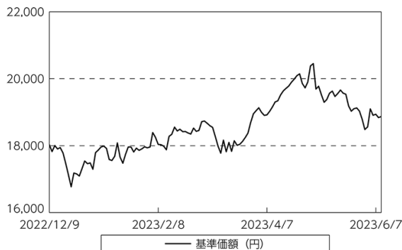
基準価額等の推移