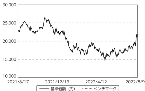
基準価額等の推移

(注) ベンチマークは期首の値をファンド基準価額と同一になるよう指数化しています。