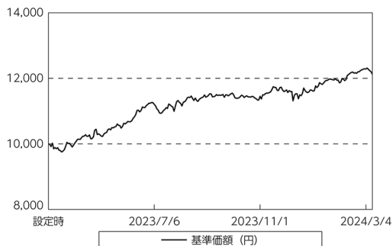
基準価額等の推移