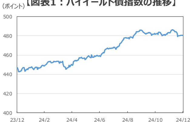
【図表1：ハイールド債指数の推移】

(注) データは2023年12月31日～2024年12月31日。(年/月) ハイールド債指数はICE BofA Global High Yield Index (米ドルベース)。