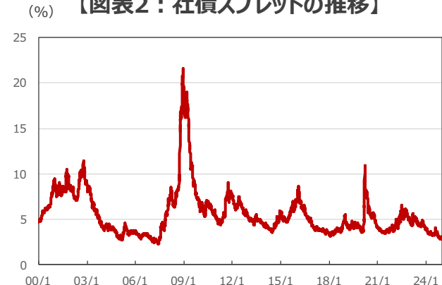
【図表2：社債スプレッドの推移】

(注) データは2000年1月3日～2024年12月31日。(年/月) 社債スプレッドは、ICE BofA Global High Yield Indexのオプション調整後スプレッド（OAS）。