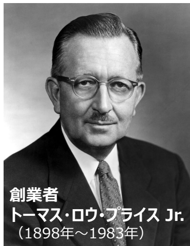
創業者 トーマス・ロウ・プライス Jr. (1898年～1983年)

1939年9月、第2次世界大戦開戦直後、戦争の恐怖やさまざまな報道などによって証券市場が混乱を呈するなか、創業者トーマス・ロウ・プライス Jr.は、 パニックに陥ることの危うさを訴え、投資目的を見失わないことの重要性を伝えました。