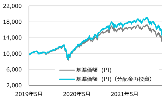
Cコース（分配重視型・為替ヘッジあり）