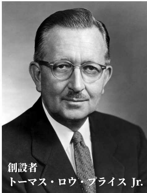
創設者 トーマス・ロウ・プライス Jr.