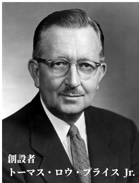
創設者 トーマス・ロウ・プライス Jr.